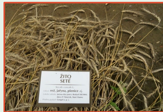
ŽITO SETE Société cereale L. rež, jařna, pšenice aj. 140-150 ročník: jařna-2014 a 2015 z Boudal (MČ 004) dárce F. Šimeček, State Hamy Pěstova poskytl: Cengel n. p. s.