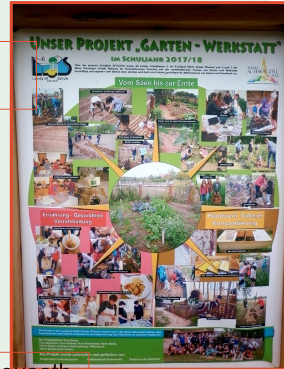
Oberpfälzer Freilandmuseum Neusath