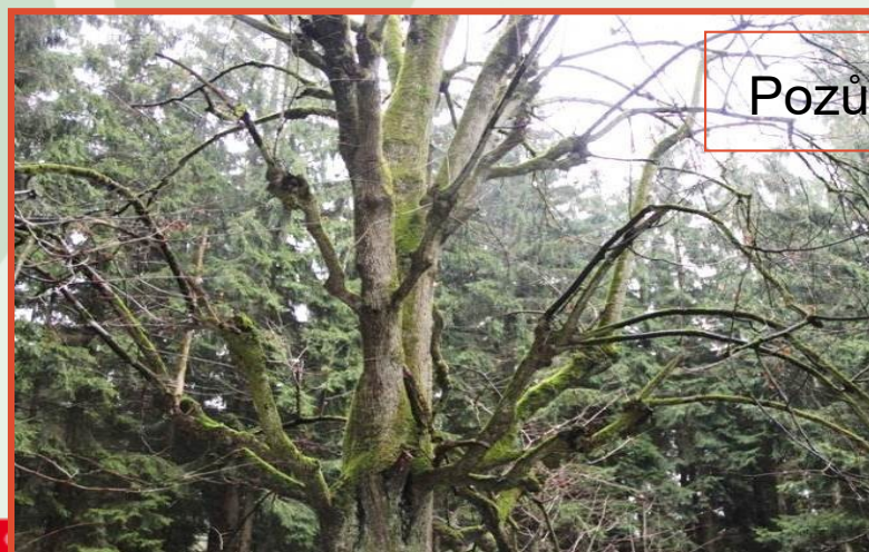
Pozůstatky ořezu in situ