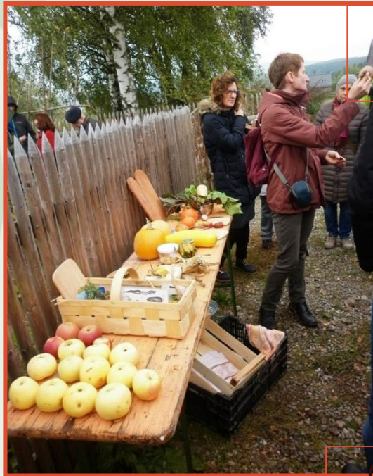
Fränkische Freilandmuseum Bad Windsheim