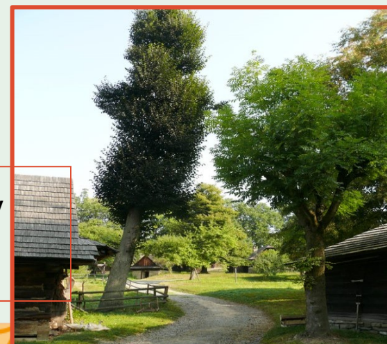
Ořez lípy v muzeu