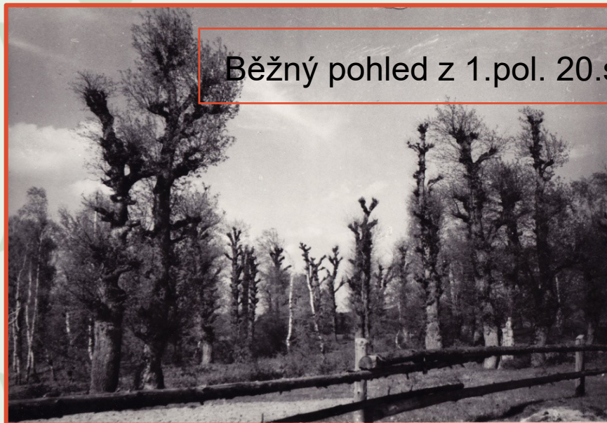
Běžný pohled z 1.pol. 20.století

- usušená zelená hmota sloužila jako zásoba krmiva pro zimní období