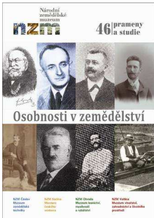
Prameny a studie č. 46