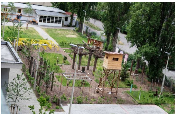
Nádvoří muzea s naučnou stezkou, 2011