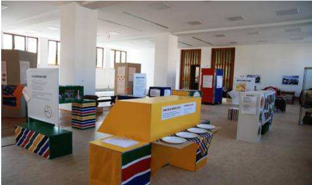
Výstava A Taste of Europe/Chuť Evropy