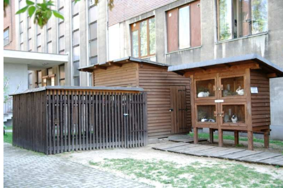
Muzejní farma, 2010