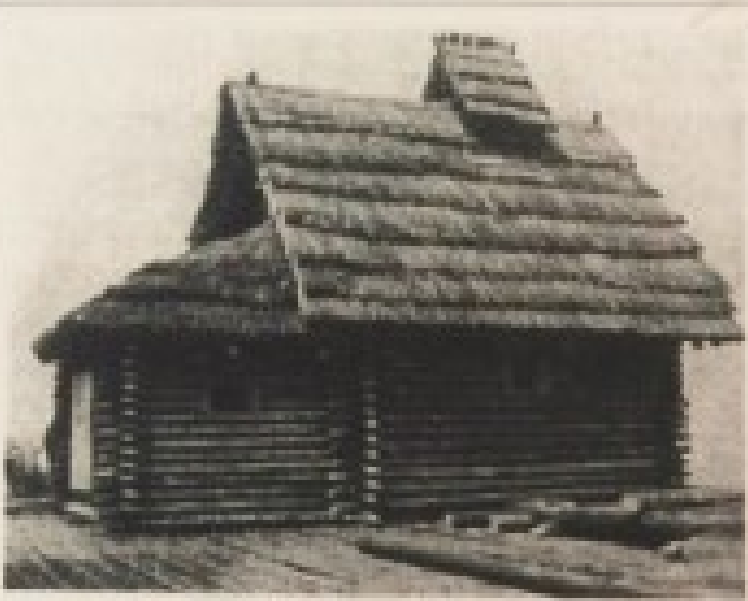
186. v. Das Herrenhaus