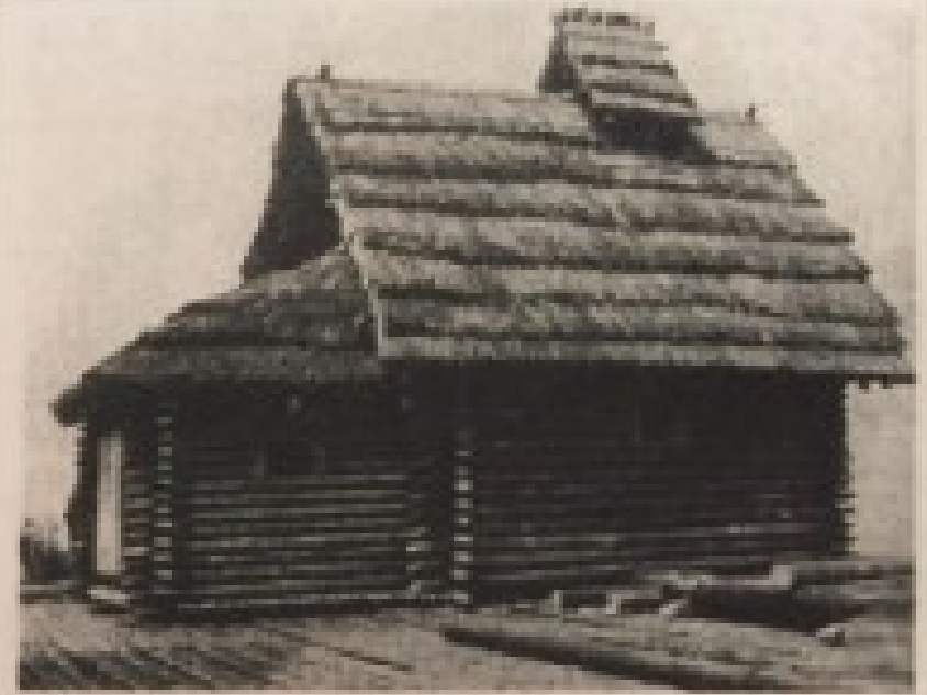
186. v. Das Haus des Dorfverwalters