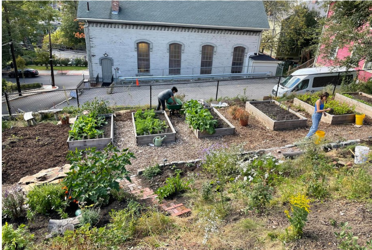
Student volunteers work "The Plot" at 4 Defoe Place, building community and gaining hands-on experience in regenerative land use.

A transdisciplinary, student-led initiative reimagines RISD's relationship with the ecosystem that surrounds it.