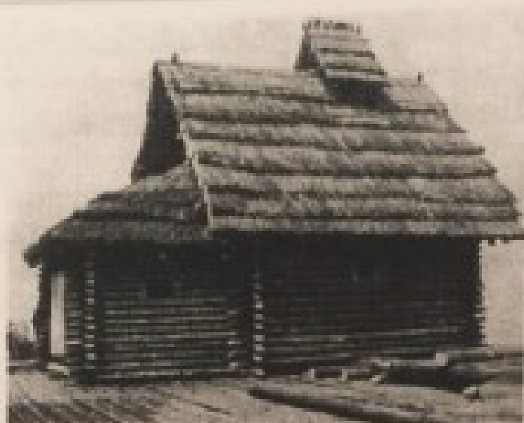
186. v. Das Glorienhaus