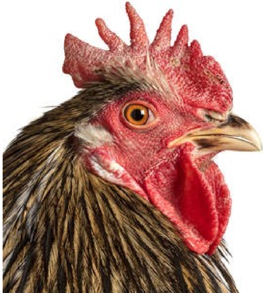
KOKOPRO: Mechelse Maatiaiskana