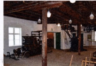
Chmelařské muzeum. Náměstí Prokopa Velkého č. p. 1950.

OD 1497 OTEVŘENO NEJVĚTŠÍ MUZEUM NA SVĚTĚ MASKOT: HOP