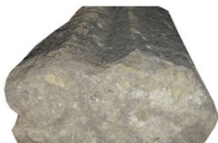
Klonební žebro z